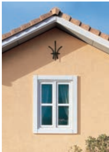
デザインたてすべり出し連装窓

アイデアとデザイン、そして環境共生を加えた機能的なアルミニウム建材製品。 これからも「今までになかった」をコンセプトに新たな製品を提供し続けます。