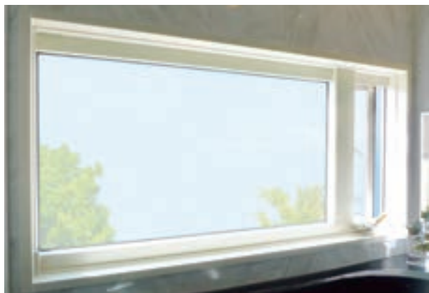
樹脂・アルミたてすべり出しFix窓