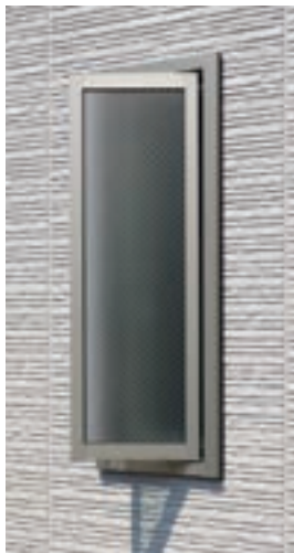
樹脂・アルミたてすべり出し窓