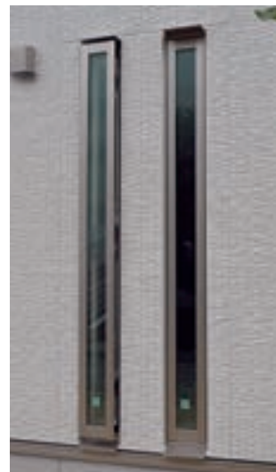
樹脂・アルミ突き出し窓