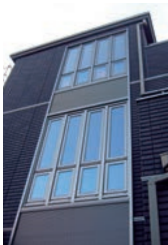
たてすべり出し連段装窓