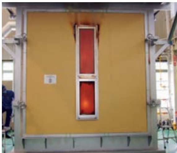
【試験体:すべり出し段装窓(W490×H2231)】